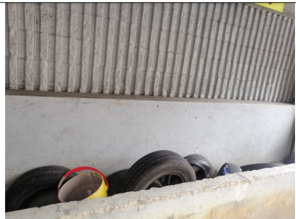
Foto 2. Vista general del acopio de llantas