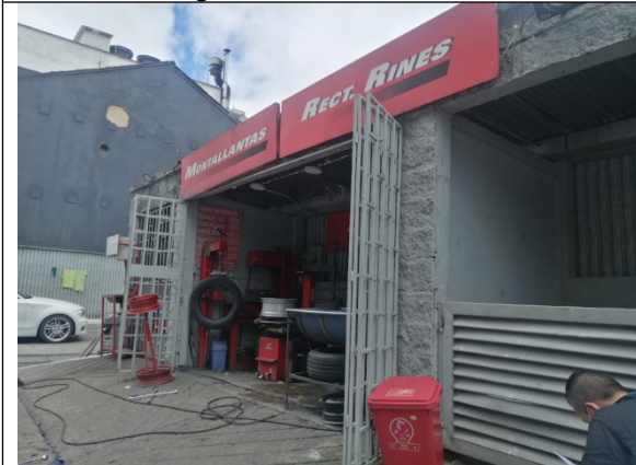
Foto 3. Vista general del establecimiento