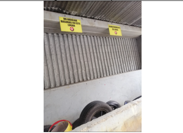
Foto 4. Vista general del acopio de llantas