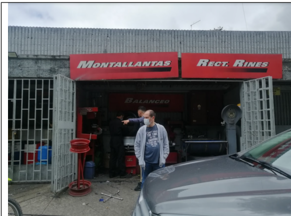
Foto 1. Vista general del establecimiento

Por lo anterior se procede a realizar visita de seguimiento (Tercera visita) el día 21 de enero de 2020 al establecimiento MONTALLANTAS LA 69 , con el fin de verificar el cumplimiento del requerimiento SDA 2019EE06545 enviado el día 10 de enero de 2019 , Se realiza la cuarta visita el día 20 de mayo del 2022, evidenciando que el establecimiento no ha cumplido con lo solicitado en los requerimientos mencionados anteriormente CON RESPECTO A: no se encuentra registrado como acopiador de llantas ante la Secretaría Distrital de Ambiente –SDA, no realiza el reporte mensual de las llantas almacenadas, gestionadas y/o vendidas en el aplicativo WEB de la SDA y no cuenta con un plan de contingencia para emergencias del establecimiento.